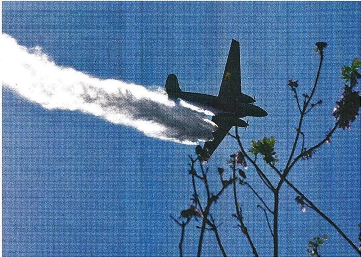
ลดหมอกควัน : เครื่องบินกองทัพอากาศทำการบินโปรยละอองน้ำเพื่อลดปริมาณหมอกควันและฝุ่นละอองในพื้นที่ภาคเหนือ โดยแต่ละเที่ยวบิน จะบรรทุกน้ำได้ทีละประมาณ 3,000 ลิตร ทำการโปรยน้ำเป็นละอองลงมาจากความสูงเหนือพื้นที่เป้าหมาย

ทั่วประเทศไปแล้ว 230 ราย หากเปรียบเทียบกับปีที่ผ่านมาพบว่าการดำเนินคดีกับผู้กระทำผิดเพิ่มขึ้น 15% ยืนยันว่าหากพบชาวบ้านมีการลักลอบเผาจะถูกดำเนินคดี แต่ถ้าหากเป็นการเผาในพื้นที่เกษตรของตนเอง เจ้าของพื้นที่ก็ถูกดำเนินคดีตามพร.บ.การสาธารณสุข ส่วนกรณีข่าวลืออ้างว่ามีกลุ่มคนลักลอบเผาป่าเพื่อหวังลดความน่าเชื่อถือทางการเมืองของรัฐบาลนั้น ยังไม่พบพฤติกรรมดังกล่าว แต่ได้สั่งการพร้อมกำชับให้ตำรวจทุกกองบัญชาการจับตาเฝ้าติดตามและให้ความรู้กับประชาชนเพื่อป้องกันผลในระยะยาว