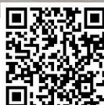
ชมคลิปวิดีโอ