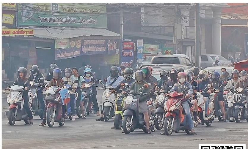
วิกฤตฝุ่น - สถานการณ์ฝุ่นควันที่ จ.เชียงใหม่ ยังวิกฤต ประชาชนที่ขับขีรถจักรยานยนต์ในเขตอำเภอเมือง ต้องสวมใส่หน้ากากอนามัยป้องกันฝุ่น PM2.5 ที่สูงเกินค่ามาตรฐานอยู่ที่ 193 มคก./ลบ.ม. อยู่ในระดับที่เป็นอันตรายต่อสุขภาพ เมื่อวันที่ 1 เมษายน

พล.อ.สุรศักดิ์ กาญจนรัตน์ รัฐมนตรี ทส.กล่าวว่า ปัญหาหมอกควันไฟป่าในช่วง 3 ปีที่ผ่านมา มีผลการปฏิบัติงานควบคุมได้ดีเป็นที่น่าพอใจ แต่ในปีนี้มีปัจจัยหลายอย่างทำให้เกิดปัญหาขึ้นมากกว่าปีที่ผ่านมา ทุกหน่วย