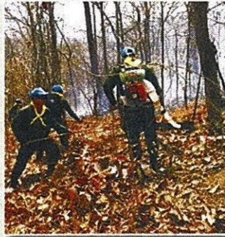
‘ในหลวง’ ทรงห่วง ปัญหาหมอกควัน 16

คพ.ประกาศ'7พื้นที่สีแดงภาคเหนือ'-จับลักลอบเผาป่า230ราย