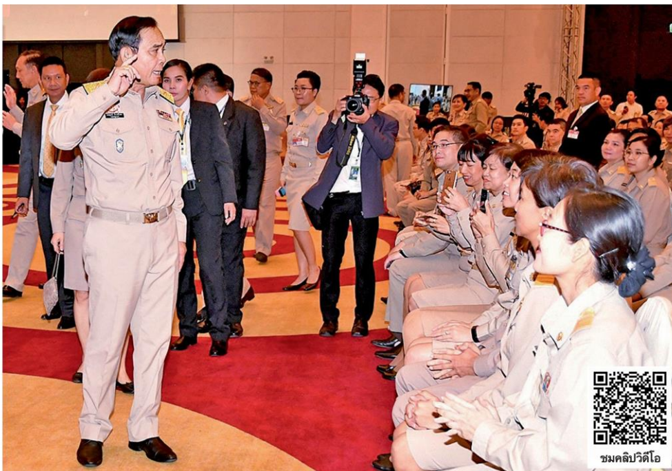
ให้อวาท - พล.อ.ประยุทธ์ จันทร์โอชา นาย รัฐมนตรีและหัวหน้าคณะรักษาความสงบ แห่งชาติ เป็นประธานในพิธีมอบเกียรติบัตรและ เข็มเชิดชูเกียรติ พร้อมให้อวาทแก่ข้าราชการ พลเรือนดีเด่นปี 2561 ที่โรงแรมเซ็นทารา บาย เซ็นทารา ถนนแจ้งวัฒนะ เมื่อวันที่ 1 เมษายน

พล.อ.ประยุทธ์ให้สัมภาษณ์ถึงการลงพื้นที่ ตรวจราชการ จ.เชียงใหม่ ในวันที่ 2 เมษายน